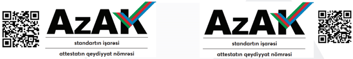
Şəkil 7: Akkreditasiya nişanının AzAK-ın sənədlərinin tanınması üçün QR kod ilə yerləşməsi

8.10. Akkreditasiya olunmuş idarəetmə sistemi sertifikatlaşdırma orqanları, hazırladıqları sertifikatlarda akkreditasiya nişanının yanında (solunda və ya sağında və ya üstündə və ya altında) AzAK-ın sənədlərinin tanınması üçün QR koduna (20X20 mm ölçüsündən az olmamaq şərtiylə) aşağıdakı formada yer verilməlidir. AzAK-ın icazəsi alınmaq şərti ilə digər istifadə formaları da tətbiq oluna bilər.