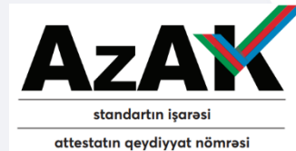
Şəkil 2: Akkreditasiya nişanı

Akkreditasiya nişanında akkreditasiya mövzusu olan standartın işarəsi və akkreditasiya olunmuş uyğunluğu qiymətləndirən qurumun akkreditasiya attestatının qeydiyyat nömrəsi qeyd olunur (şəkil 2).