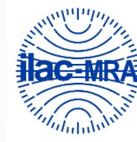
Şəkil 4. ILAC MRA nişanı

ILAC MRA nişanı: ILAC-a məxsus olan söz/təsvirdən ibarət nişandır. Bu nişan Qarşılıqlı Tanınma Sazişi ilə əlaqəlidir və yalnız ILAC və tanınan regional əməkdaşlıq təşkilatları tərəfindən istifadə oluna bilər (Şəkil 4).