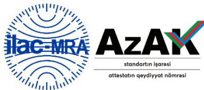
Şəkil 6. Akkreditasiya edilmiş uyğunluğu qiymətləndirən qurumlar üçün birgə (kombinə edilmiş) ILAC MRA nişanı

Akkreditasiya edilmiş uyğunluğu qiymətləndirən qurumlar üçün birgə (kombinə edilmiş) ILAC MRA nişanı: ILAC MRA nişanı ilə akkreditasiya nişanının birgə istifadə edilməsindən yaradılmış nişandır (şəkil 6). Bu nişan AzAK tərəfindən akkreditasiya olunmuş və bu nişandan istifadə etmək üçün hüququ olan UQQ tərəfindən istifadə oluna bilər.