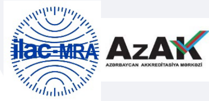
Şəkil 5. AzAK üçün birgə (kombinə edilmiş) ILAC MRA nişanı

AzAK üçün birgə (kombinə edilmiş) ILAC MRA nişanı: ILAC MRA nişanı ilə AzAK-ın loqosunun birgə istifadə edilməsindən yaradılmış nişandır (şəkil 5). Bu nişan ILAC MRA sazişi imzalamış AzAK (tamhüquqlu üzv olduğu fəaliyyət sahəsinə uyğun olaraq) tərəfindən istifadə oluna bilər.